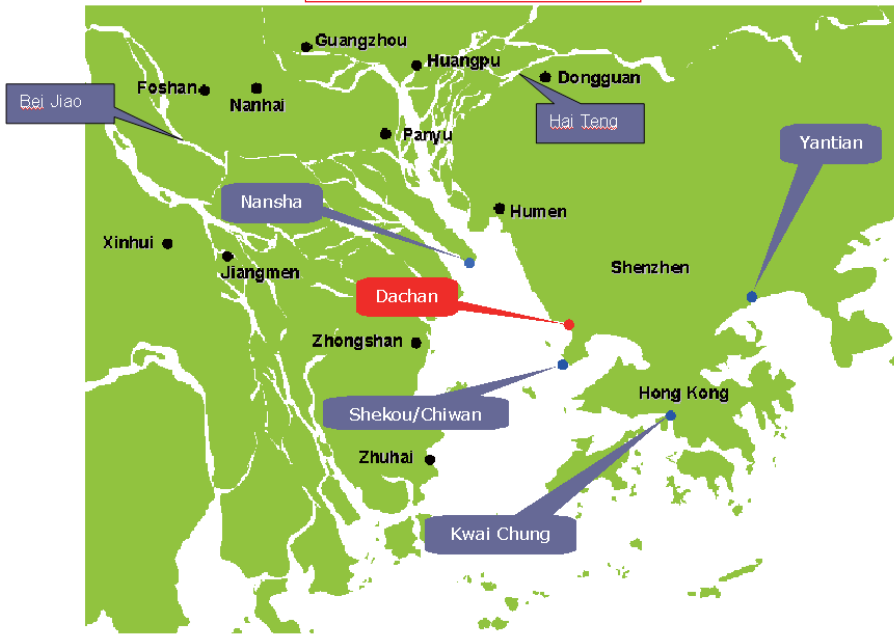
栢坚在中国南部覆盖的维修网络

从2009年客户问卷调查报告中，我们认识到广泛的维修网点是影响客户选择栢坚服务的最主要因素，我们很高兴广泛的维修网点成为了市场中的竞争优势。从下面的地图中看到，我们已经覆盖了华南区主要大码头和驳船码头，并且在附近设立了堆场设施以满足客户的需求。