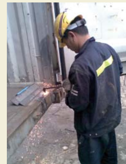
Prevent plywood floor to damage