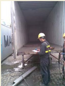
Detect non-compliance, will prepare N.C.R. when found out non-compliance during repair.